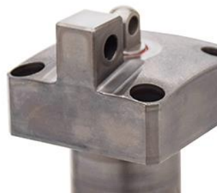
【変更後】 リンク支点部一体式