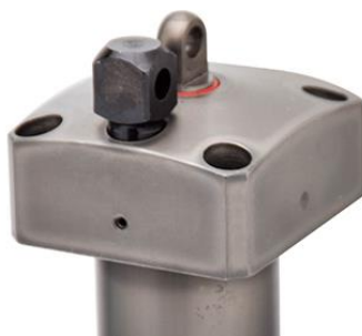
【現行品】 リンク支点部分割式

取付寸法や基本性能の変更はございません。現行品と互換性を有します。ただし、外観が異なります。