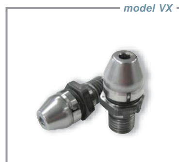
簡易で便利な手動位置決めピン