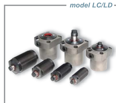
充実したラインナップのワークサポート